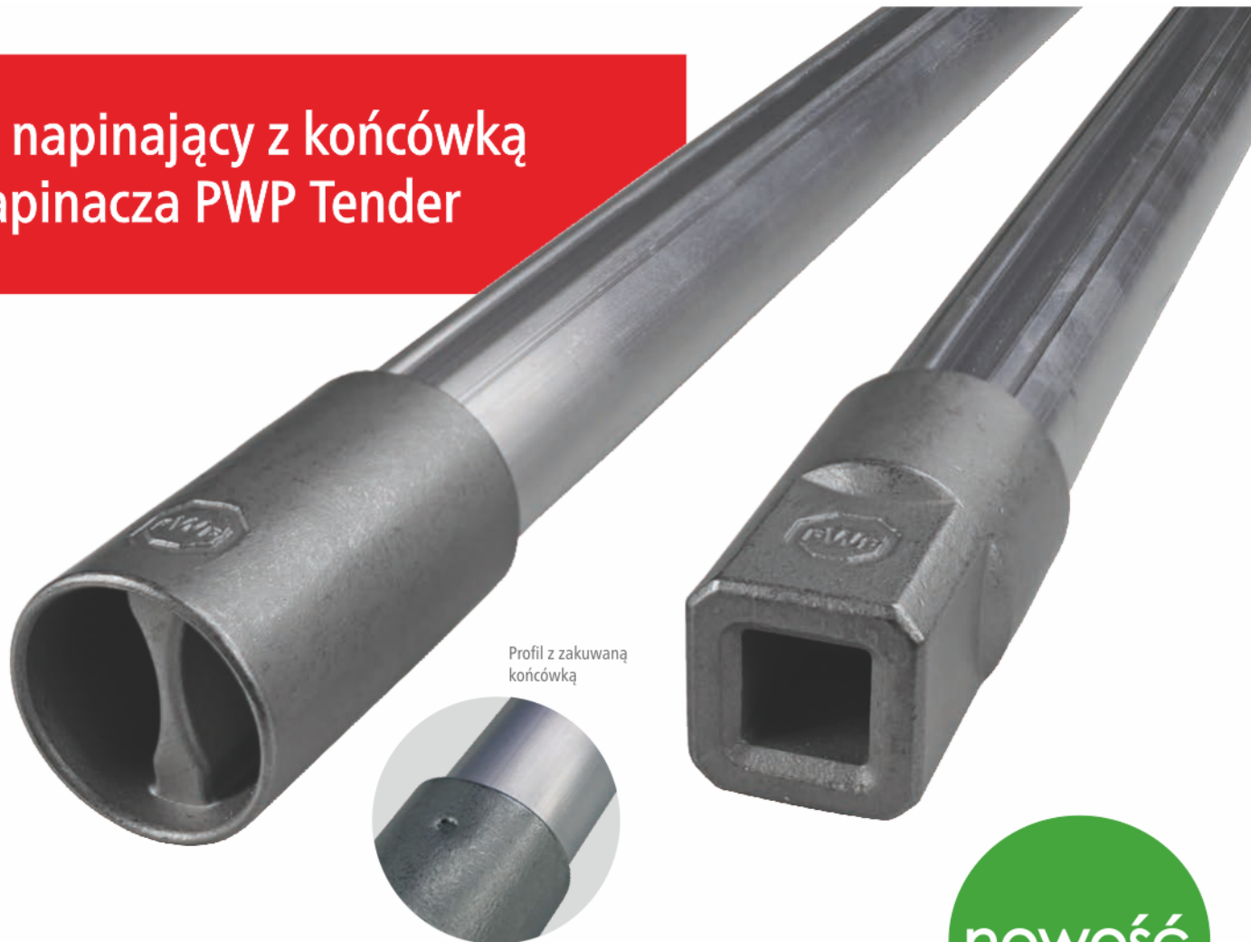
Profil z zakuwaną końcówką