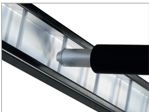
Belka okrągła z S-Line ze sztabkową szyną kotwiącą 142138636

Obustronne czopy ( \varnothing 19 mm/24 mm/ szczelina: 9 mm) umożliwiają wykorzystanie belki ze wszystkimi listwami zabezpieczającymi szczelina-otwór-szczelina i listwami zabezpieczającymi kombi 3008/3009, listwami zabezpieczającymi z otworami okrągłymi oraz z listwami zabezpieczającymi profil Airline.