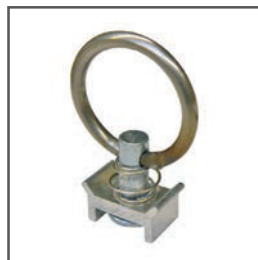
142138570 Pojedyncze mocowania Airline 570