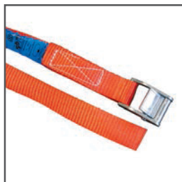
142138524 Pas z zamkiem zaciskowym 300