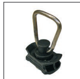
142138600 Pojedyncze mocowania Airline 600

Suer Polska Sp. z o.o. Bonikowo, ul. Dworcowa 17, 64-000 Kościan