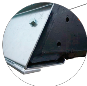
Wypożenie standardowe z blachą 4 mm oraz naspawaną krawędzią zużywalną 80 x 8 mm