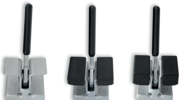
Zakres blokowania 45 mm